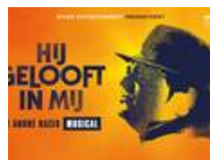
Hij Gelooft in Mij - Elk 2e ticket gratis!