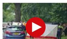
52-jarige man overleden bij zeer ernstige aanrijding tussen Enschede en Hengelo