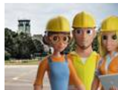
WEEKDEAL: Wij bouwen de Toekomst