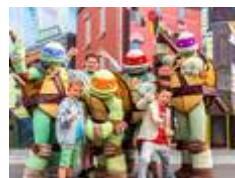
2 dagen Movie Park Germany + hotel