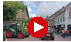
Tientallen tractoren bij groot boerenprotest in binnenstad Enschede: ‘Weg met de...